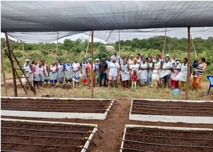
Proyecto implementado por Fundación Patagonia Compassion en Kenia

Es un fondo de cooperación internacional establecido por el Gobierno de Chile el año 2011, por medio del cual el Estado, en el marco de su política exterior, busca potenciar la cooperación internacional fundamentalmente por medio de la implementación de proyectos de asistencia técnica y a través de ayuda humanitaria que brinda a otros países. Es respecto de la asistencia técnica, que el Fondo Chile desarrolla las presentes Bases en el marco de la Convocatoria 2024.